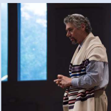
マーティ・ワールドマン